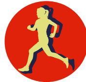
LA VERRIE'TABLE 7 km, 12 km