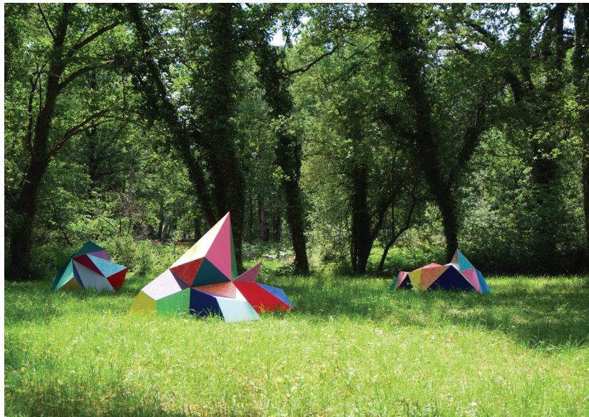
Elodie Boutry : Sous-bois - 2018