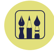
EXPO GRAND AIR