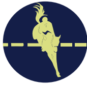
Concours Complet International 1,2,3,4*