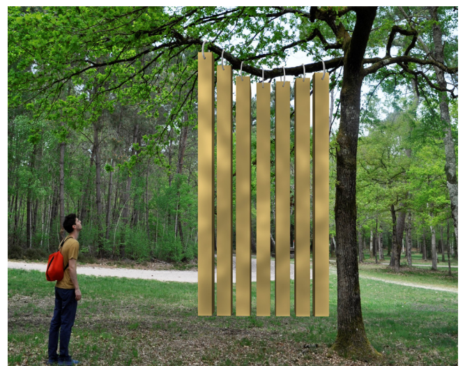
Camille Techer : the size of the container - 2019