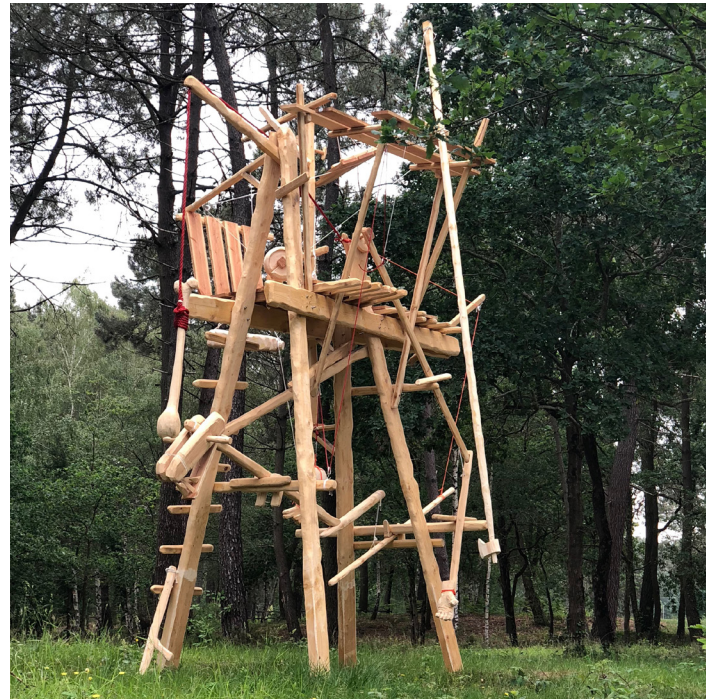
Mathieu Archambault de Beaune : Cheval, cheval, cheval, ni oui ni non - 2018